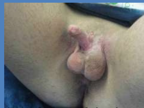
FtM ♀ - neofaloplastia metoidioplastia